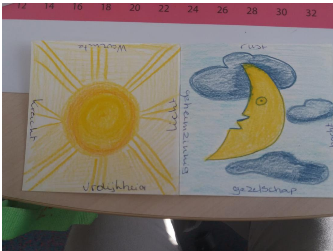
De zon (en Maan) van een cursist.